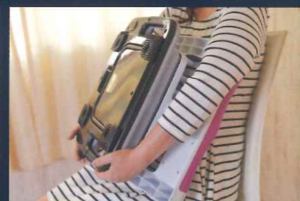
（腋窩・鼠経リンパ節）