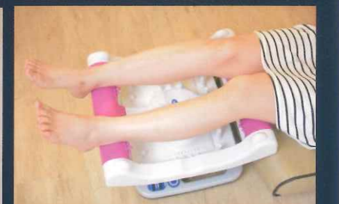
（膝窩・後脛骨リンパ節）

※リズムの「有」「無」で効果の違いは特にありません。ご自身の好みで切り替えをしてください。