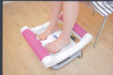
（腎臓・肝臓・心臓の反射区）