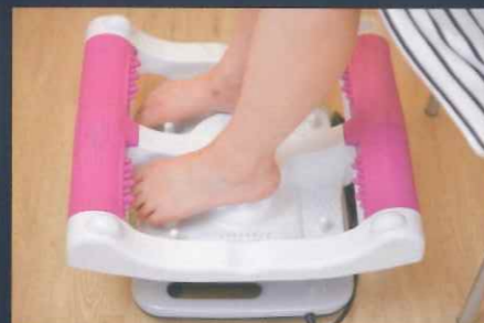
（腎臓・肝臓・心臓の反射区）