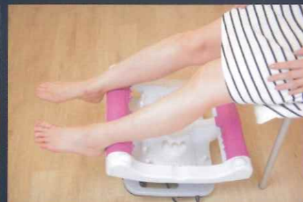
（アキレス腱・直腸の反射区）