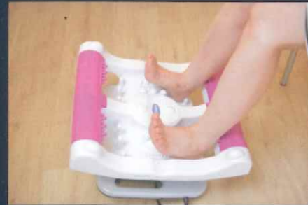
（坐骨・仙骨の反射区）

特に当て方に決まりはありませんが、足のツボ（反射区）を参考にしながら全体を刺激してください。