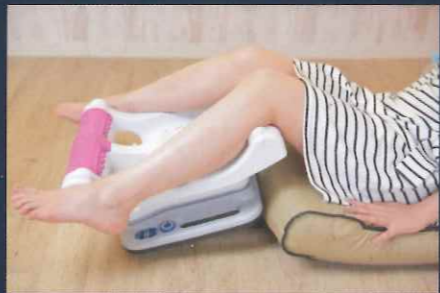
（ひざ裏・ふくらはぎ）